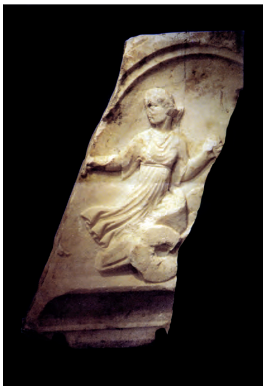
Villach, stele romana

L'epoca del cancellierato di Paolo Santonino è quella delle incursioni turche e - per la Carniola – delle guerre tra l'imperatore Federico III e il re d'Ungheria Mattia Corvino.