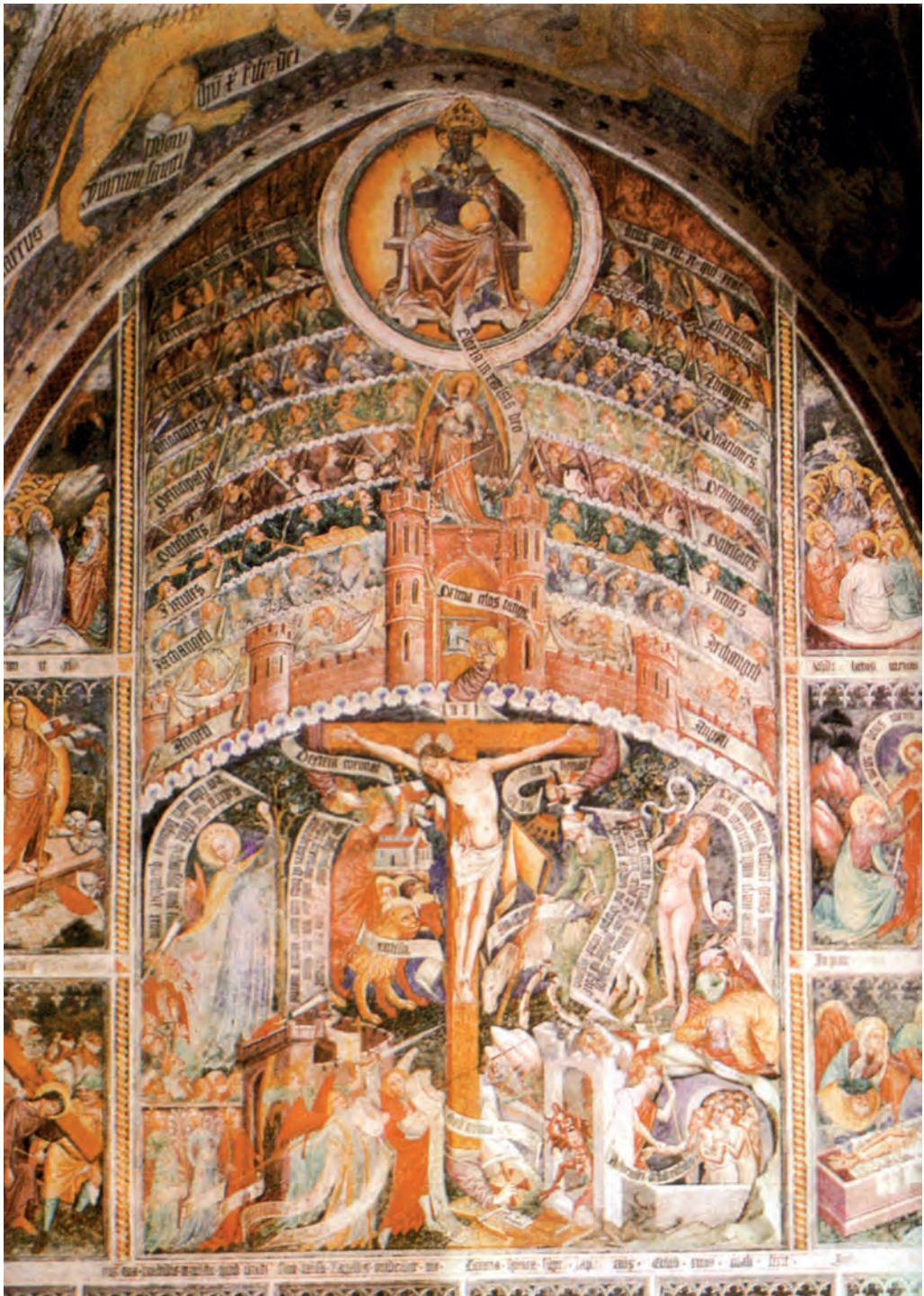
La croce vivente con i cori degli angeli (Parrocchiale di Thörl - Maglern)