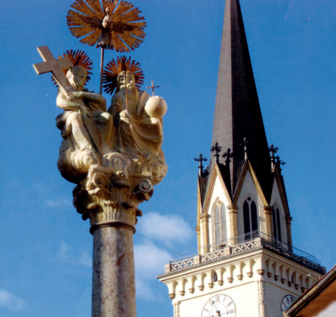
Villach, la chiesa parrocchiale di St. Jakob