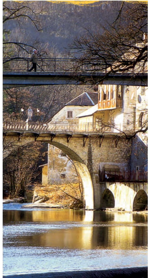
Škofja Loka, il ponte

Ci viene fornito uno schema del corso della giornata (durata del riposo notturno, modalità di computo delle ore, orari e durata dei pasti). Vengono dettagliate