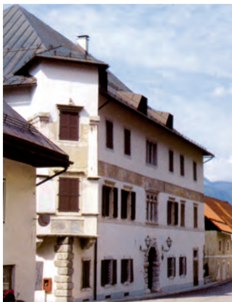
Malborghetto, palazzo veneziano

Molte le conferenze sui temi dell'arte culinaria, seguite da esempi "concreti."