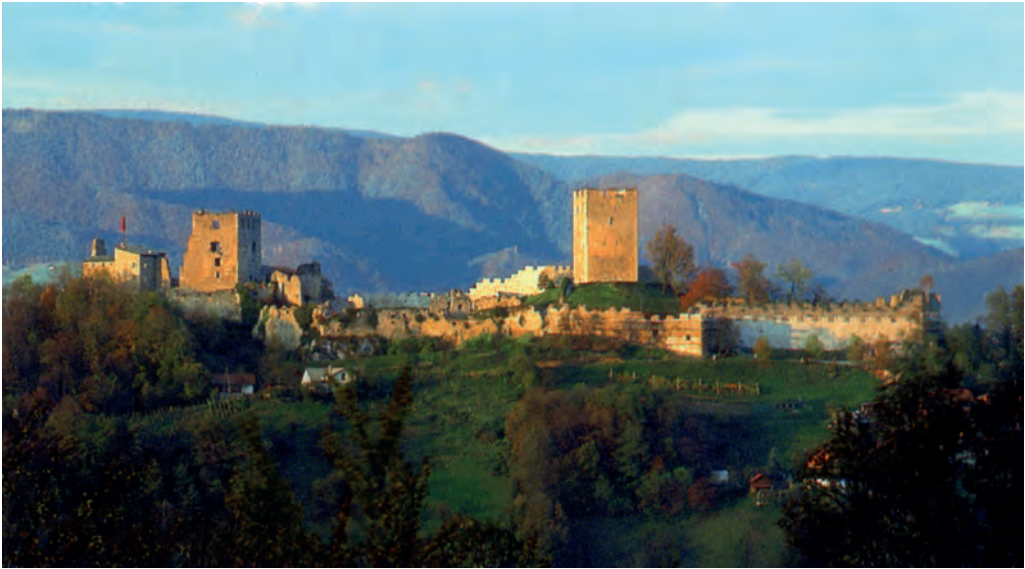
Celje, Stari Grad

le sistemazioni e, di quando in quando, veniamo a conoscenza di particolari riguardanti l'abbigliamento e l'igiene. Per qualche castello, per parecchie chiese e per alcune borgate i resoconti di Santonino costituiscono il più antico documento che ne attesta l'esistenza.